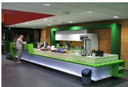
Komea vastaanottotiski tervehtii tulijaa. Lisää palveluja löytyy seinänaapurina olevasta keilahallista, johon kulkee yhdyskäytävä.