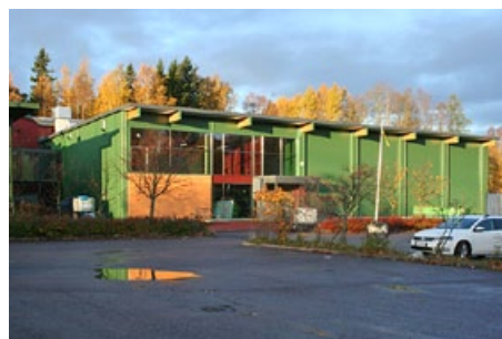
Talihalli sijaitsee Helsingin Pitäjänmäellä, hyvien liikenneyhteyksien varrella ja monien muiden liikuntapaikkojen läheisyydessä.